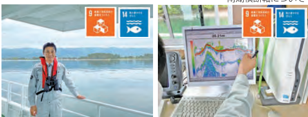
鮎の魚群を、たくさん確認できました。